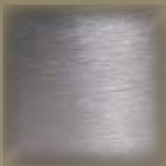
RST - look